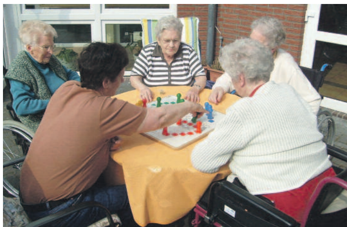
Langweilig wird's nie! Bewohnerinnen beim „Mensch-ärgere-Dich nicht-Spiel“ im „to huus“

Das Altenpflegeheim „to huus“ hat übrigens Platz für 48 Bewohner. 46 Plätze sind bereits vergeben, so gefragt ist die stationäre Pflegeeinrichtung im Seemannsort. Hinzu kommen noch Angehörige, die sich zur Kurzzeitpflege in die Obhut der Pflegeprofis in Barbel begeben. Die Bewohner kommen vor-