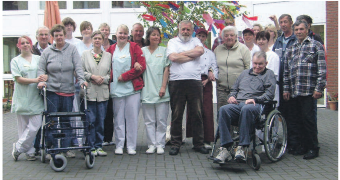
Verstehen sich prächtig: Bewohner und Bewohnerinnen und das Pflegedienstpersonal